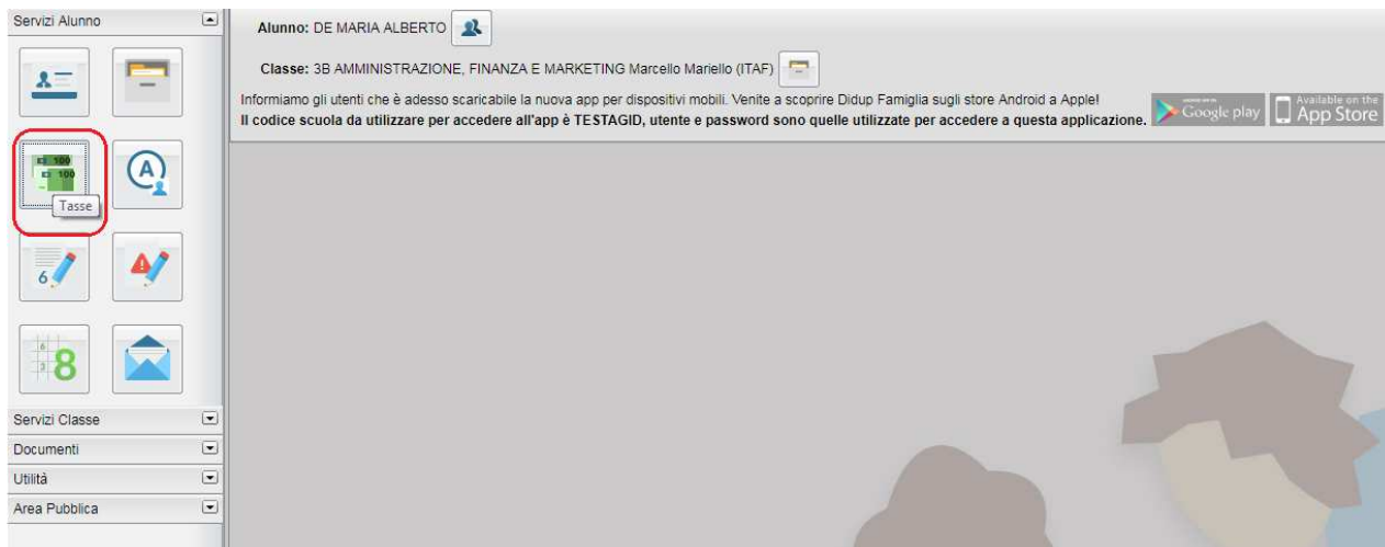
(accesso ai servizi di pagamento)

Il servizio di pagamento delle tasse e dei contributi scolastici è integrato all'interno di Scuolanext - Famiglia, ed è richiamabile tramite il menù dei Servizi dell'Alunno .